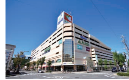
アル・プラザ八日市 1500m 徒歩19分