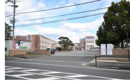
東近江市立聖徳中学校 500m 自転車3分