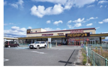
MEGA ドン・キホーテ東近江店 240m 徒歩3分