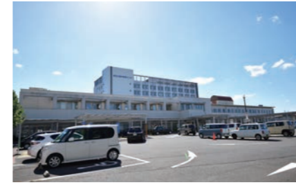
東近江総合医療センター 3900m 車10分