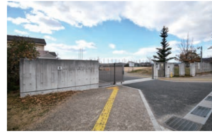
八日市南小学校 1600m 徒歩20分