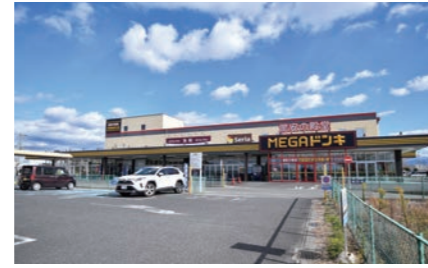
MEGA ドン・キホーテ東近江店 240m 徒歩3分