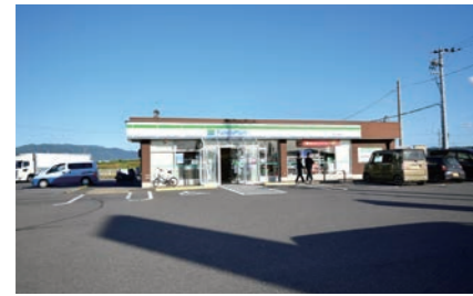
ファミリーマート東近江今堀町店 750m 徒歩10分