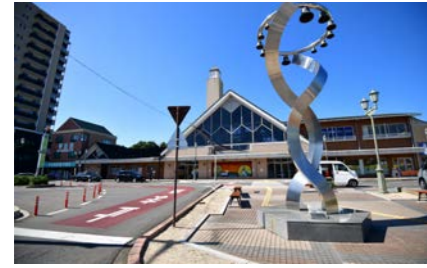
八日市駅 1900m 車5分