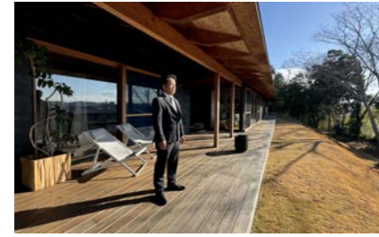
東近江市立聖徳中学校 500m 自転車3分