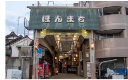
八日市ほんまち商店街 1600m 徒歩21分