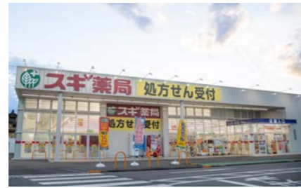
スギドラッグ八日市南店 550m 徒歩7分