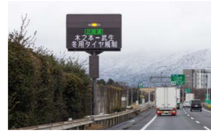
八日市インター 5000m 車13分