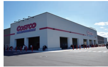
コストコ東近江倉庫 4000m 車10分