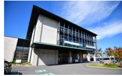
東近江市役所 5200m 車7分